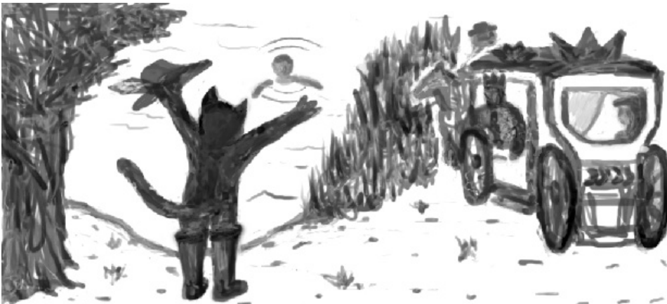
Skizze aus einer Redaktionssitzung

Und was passiert nun? Zunächst einmal passiert eben das nicht, was er immer befürchtet hatte, nämlich, dass es ihn schlimm treffen werde, wenn er sich gottvertrauend auf eine offene Sache einließe (wie mit der Erbschaft). Er wird nicht das Opfer von irgend etwas Schlimmem! Er hat also nicht den Schwarzen Peter in der Hand. Das ist der eine Teil der neuen Erfahrung. Es passiert aber noch etwas Wichtigeres,